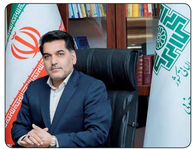
امروز خراسان جنوبی - حمیدی

۶۷ میلیارد تومان به حساب شهرداری ها و دهیاری های استان طی ۴ ماهه نخست سال جاری واریز شد