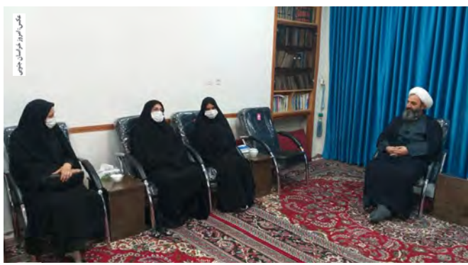
مدیر کل کانون پرورش فکری خراسان جنوبی با امام جمعه فردوس دیدار و گفتگو داشت. در این دیدار، مسائل مربوط به تربیت دینی کودکان و نوجوانان و همچنین مسوولیت‌ها و نقش کانون در راستای تربیت اخلاقی و فرهنگی نسل آینده‌سازان مورد بحث و تبادل نظر قرار گرفت.